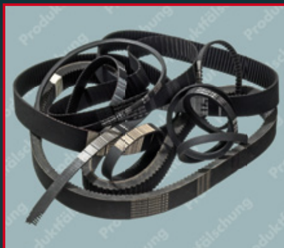
Plagiate von Optibelt Riemen

Kaufen Sie Ihre Optibelt Produkte ausschließlich bei einem Optibelt Vertragshändler!